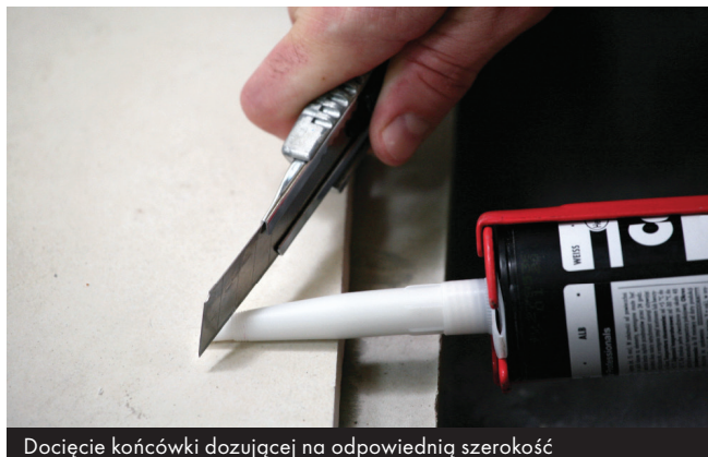
Docięcie końcówki dozującej na odpowiednią szerokość

Odciąć końcówkę kartusza tuż nad gwintem. Nakręcić końcówkę dozującą i dociąć ją odpowiednio do szerokości wypełnianej szczeliny.