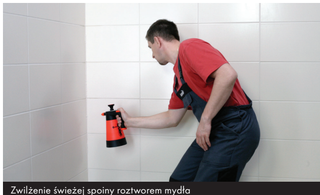
Zwilżenie świeżej spoiny roztworem mydła

W ciągu 5 minut powierzchnię wypełnienia należy spryskać wodnym roztworem mydła i wygładzić podobnie zwilżonym narzędziem, usuwając jednocześnie nadmiar materiału.