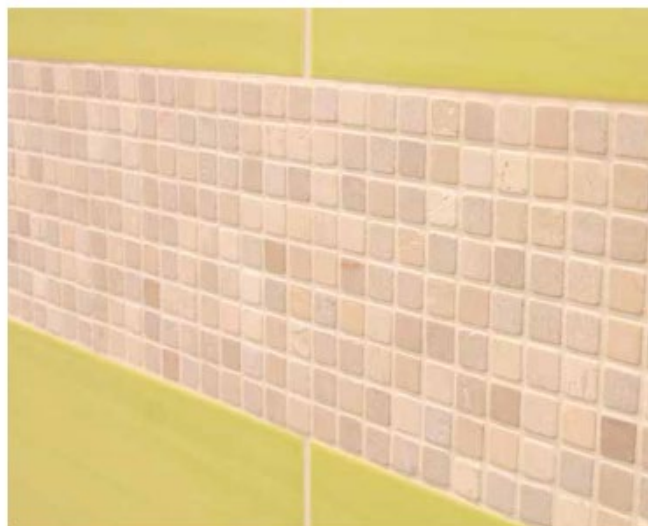
10 Powierzchnie z płytek ceramicznych i mozaiki kamiennej za fugowane fugą Sopro DF 10®.