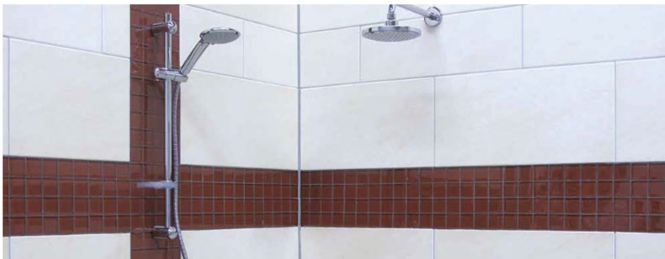
11 Okładzina w łazience zaspoimowana fugą Sopro DF 10®.