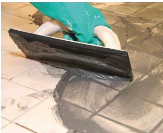
7 Spoinowanie płytek gresowych fugą Sopro DF 10®.