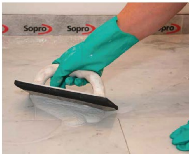
8 Spoinowanie wrażliwego na przebarwienia kamienia naturalnego fugą Sopro DF 10®.