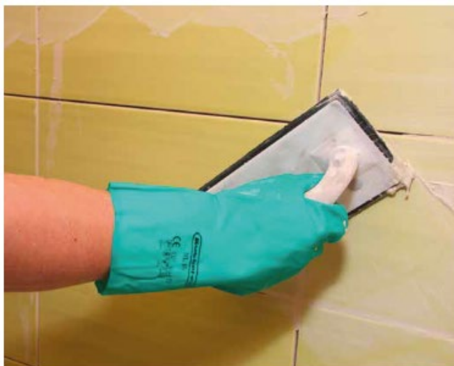
9 Spoinowanie ściennych płytek ceramicznych fugą Sopro DF 10®.